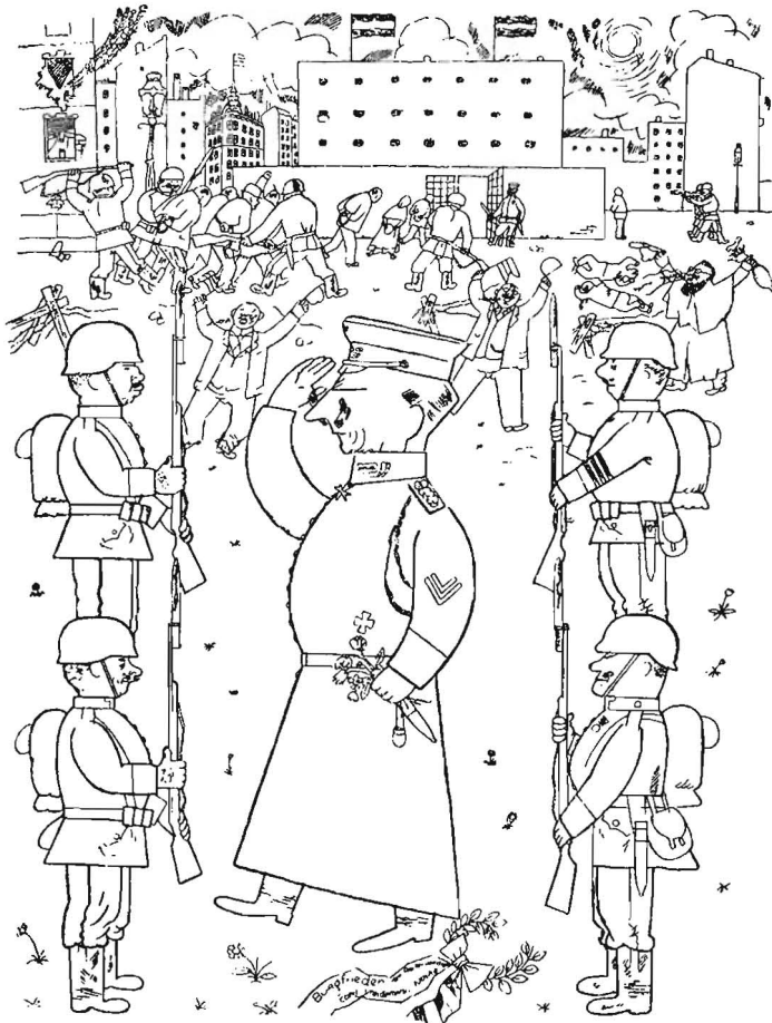
Rückkehr geordneter Zustände

quer to its cause. In other words, the poorest part of the population, and largely the supporter of the UP, was made to finance the consumption of those social groups which were most aggressively against the former programme and government.