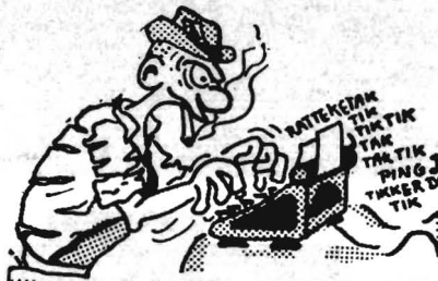
overgenomen uit Quad-Novum 27-4-'77

Met dank overgenomen uit 'Intermediair' 7 april.