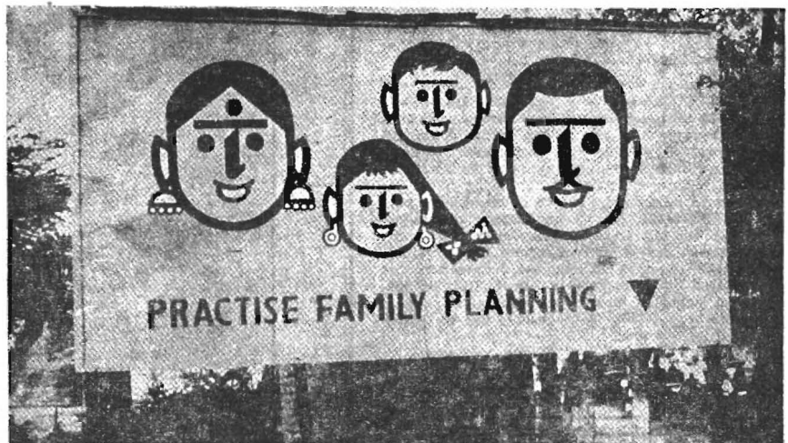
'Een of twee, maakt iedereen tevree'. (India)

In de trendmatige groei van 1952 - 1971, die zowel in de landbouwsector als in de niet-landbouwsector valt te constateren, doet zich tegelijkertijd in beide sectoren een tijdelijke terugval voor gedurende twee perioden: de mislukking van de Grote Sprong Voorwaarts en de recessie tijdens de Culturele Re-